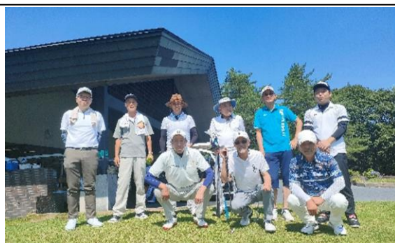
7/17 会津坂下支部 会員親善ゴルフ大会