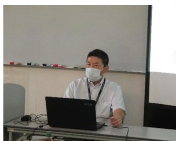
9/27 デジタル戦略委員会