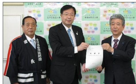
左から福島消防団長、室井市長、遠藤会長