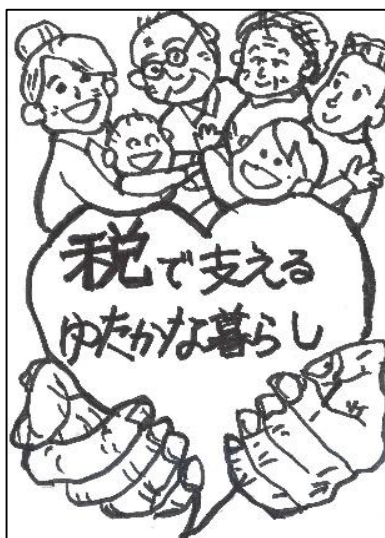
行仁小 鈴木 啓仁