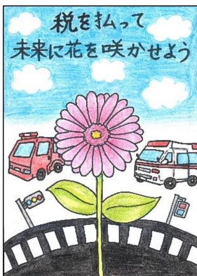
鶴城小 五十嵐 優李