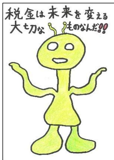
猪苗代小 高橋 一真