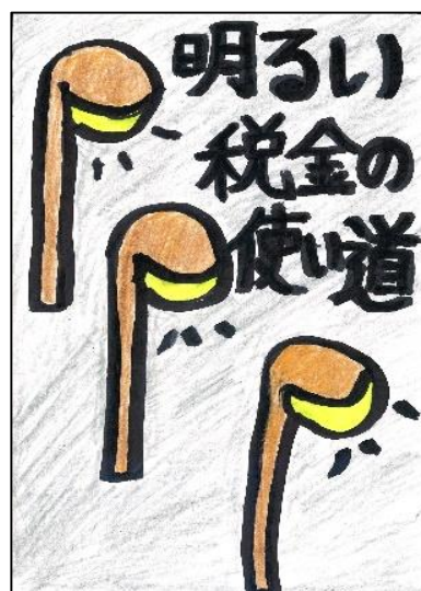
磐梯第二小 長澤 龍士